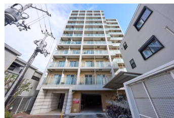
実証実験を行ったマンションの外観

場所：兵庫県尼崎市の賃貸マンション（築18年 最寄り駅徒歩9分） 所有者：株式会社ジョイテック 期間：2024年6月1日～同年6月30日 対象：空室6戸、居住中入居者14名 募集家賃：5万円台 実証内容：費用上乗せ時の募集期間への影響 居住中における入居者のスマートロック設置ニーズ調査