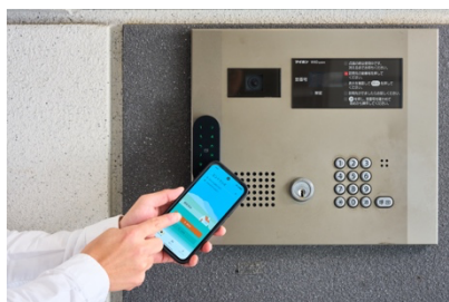
スマホで鍵を開ける様子（エントランス）